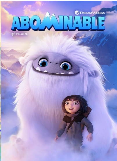
Abominable : Yi