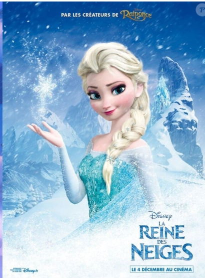
La Reine des neiges : Elsa